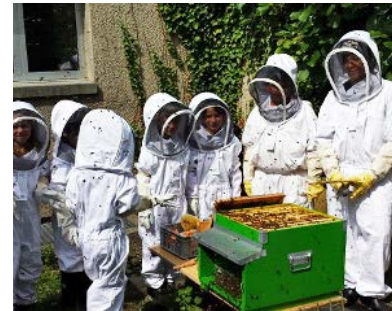
Wildbienenhotels bauen und eigenen Honig produzieren – eine Schulklasse aus Chur spielte bei der letzten Preisverleihung mit ihrem Bienenprojekt ganz vorne mit.

WWF Regiobüro AR/AI-SG-TG Merkurstrasse 2 9001 St.Gallen T: 071 221 72 30 Sabine Göltenboth sabine.goeltenboth@wwfost.ch