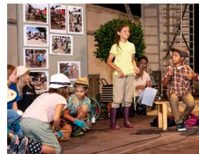
Es wartet die grosse Bühne: An der Preisverleihung vom 21. August im Würth Haus Rorschach präsentieren die Nominierten ihr Projekt.