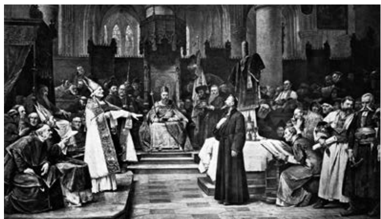
Jan Hus wurde vor 600 Jahren auf dem Konzil von Konstanz verurteilt. Am Reformationssonntag wird ihm dieses Jahr in der Evangelischen Kirche Rorschach der Prozess gemacht.