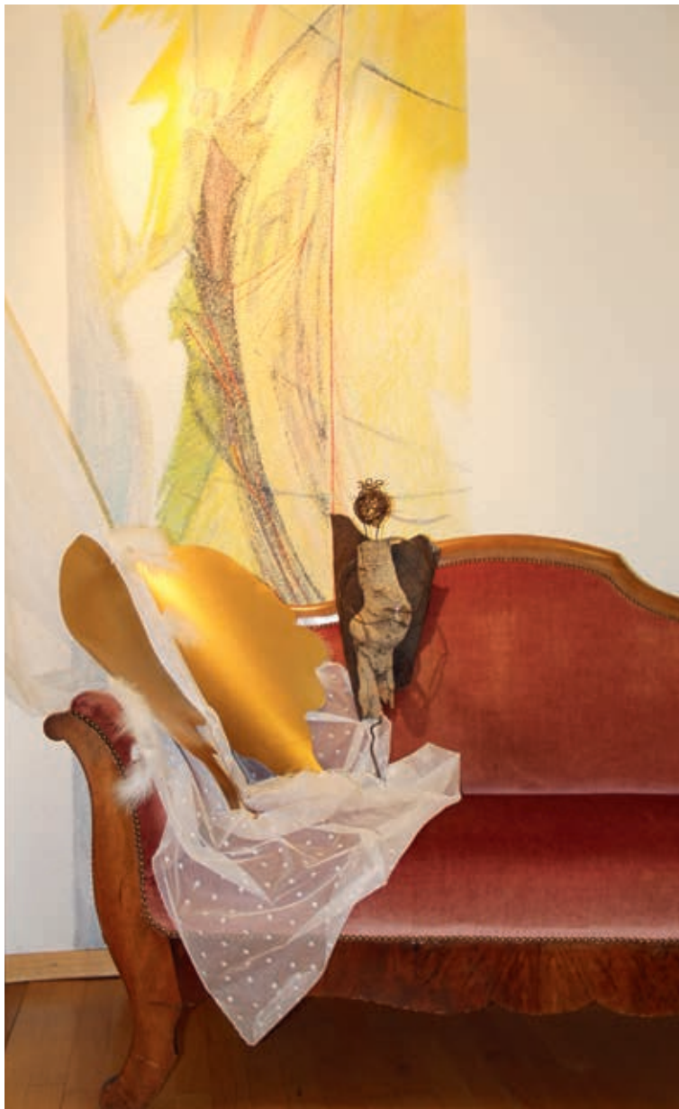
Engel nehmen auf dem Sofa Platz. Die Evangelisch-reformierte Kirchgemeinde Rorschach lädt Frauen zu einem kreativen Abend rund um das Thema «Engel» ein.