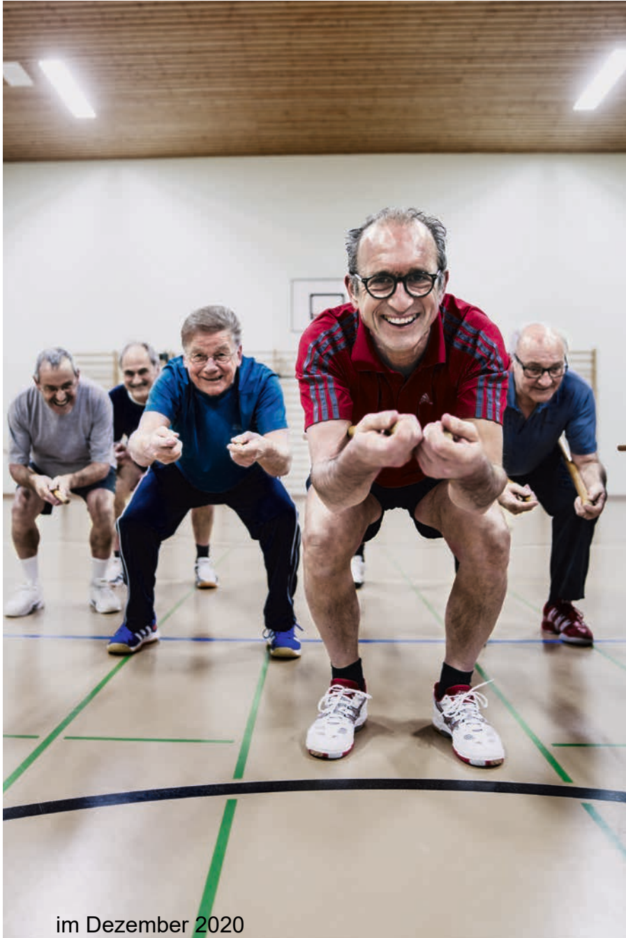
im Dezember 2020